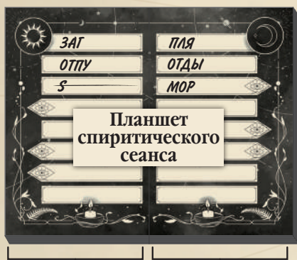
Сторона команды Солнца Сторона команды Луны

В каждой команде появляется больше медиумов. Они действуют сообща, делят один и тот же набор карт и могут обмениваться тайными записками. Любой из них может объявить тишину.